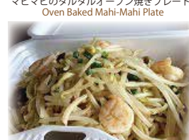
えびやきそば Shrimp Fried Noodles