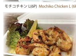
ガーリックシュリンプ Garlic Shrimp