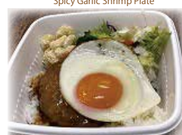
ロコモコ Loco Moco