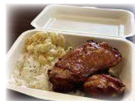
モチコチキンプレート (2p) Mochiko Chicken Plate (2p)