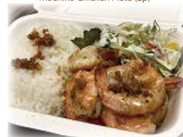
ガーリックシュリンプレート Garlic Shrimp Plate