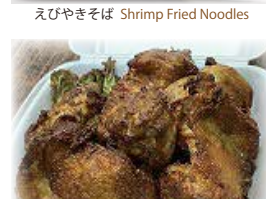
モチコチキン L(6P) Mochiko Chicken L (6P)